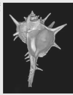
ארגמן חד-קוצים (חלזון הארגמן)