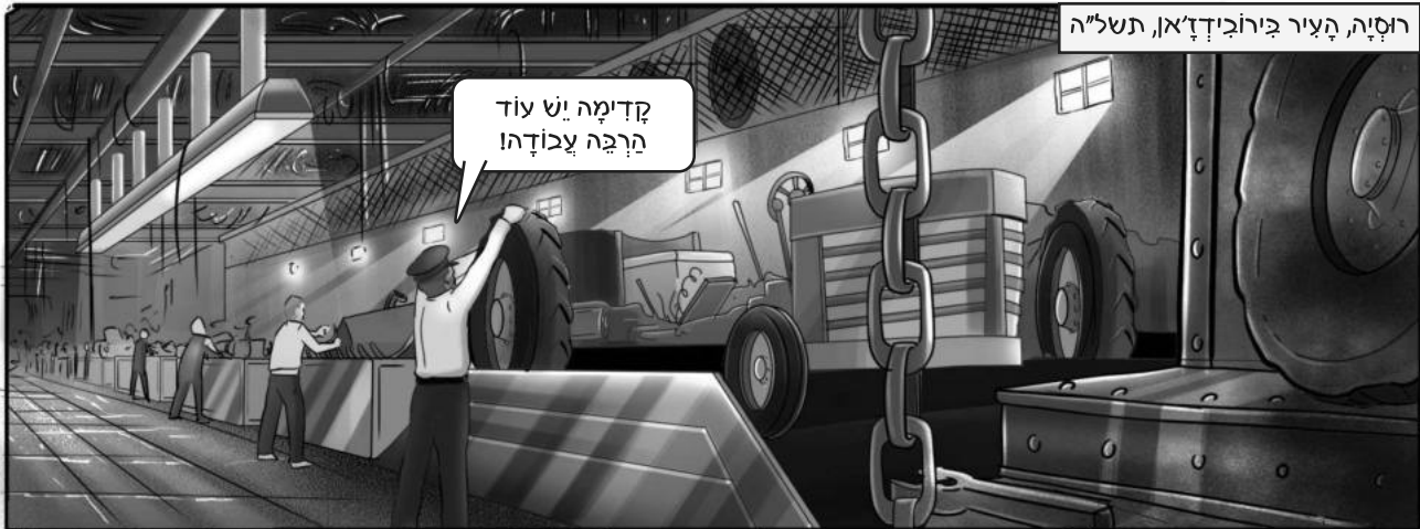
רוסיה, העיר בירוז'ד'אן, תשל"ה

בשנות תרפ"ח, החליטה המפלגה הקומוניסטית להקים מחוז יהודי עצמאי בחבל ארץ נדח בקצה רוסיה. אלפי משפחות יהודיות נשלחו לשם כדי לישב את המקום. הנסיון לא צלח, אך במשך שנים רבות לאחר מכן נותרה במקום אכלוסיה יהודית.