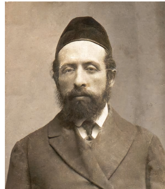
רבני אישישוק: רבי יוסף זונדל הוטנר