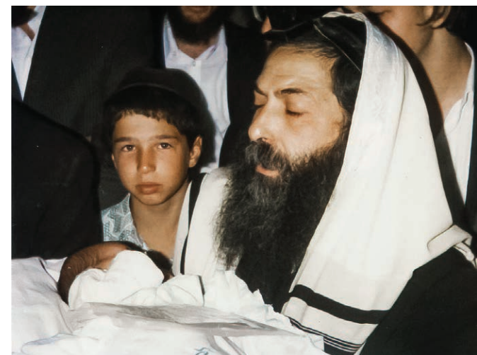
אבא בברית שלי

שמו של רבי אלחנן, משנתו והשקפתו היו שגורים בפיו של אבא כל הימים. את שמו הנציח בשם ישיבותיו 'אור אלחנן', ואת משנתו והשקפתו – בהוצאת כתביו לאור ובהפצתם מתוך יגיעה ומאמץ רבים.