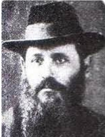
הגאון החסיד ר' שמואל שניאורסון