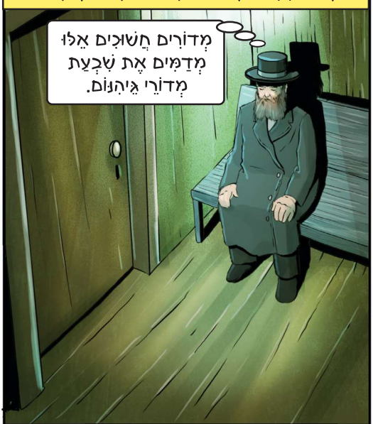
מסדרונות בית הקלא חשוכים, מוארים בננסים זעירים, ומשני הצדדים תילים חמושים, עוקבים במבטיהם המאיימים אחר הלוכו של הרבי.

מדורים חשוכים אלו מדמים את שבצת מדורי גיהנום.