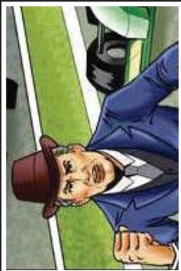
אדם ארמוני ומספן, ראש ארגון הטרור במחוצות. כסוף השלג