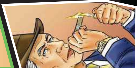
והיוקם סטריק, וסגמנטו סטריק טרוריסט

אנשים וחודשים. אל פרננדו בסדרת, "המרוץ", סדרה רוחה מעתי, דגלמה ומקומות? האם יצליח יוני להקלל מידי, הטרוריסטים? להנחית אותי, בגללים בלתי נאומות בעליל, להשאיר בעולם המרוצים, מקום בו הוא יוני ארץ הטרוריסט. אצמו לכוד בידי ארגון פר מוצא יוני את