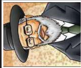
מאדולי הדור, שיחתי עם יוני, רצח לפני המרוץ, מצרעת את לבו של יוני. ראש הנישואי