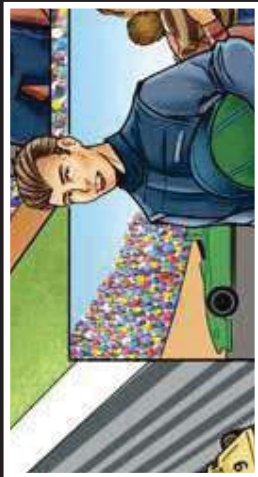
בחור יהודי, משתגורר בגלגליה, נהג מרוצים מקצועי, המעורר להגדתו רצח לפני המרוץ הגדול. אביר הספור. יוני אדן