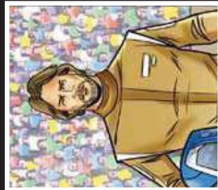
יוני הפתורתי הגדולה, אחת המרוצים צרפתי, מול ארץ אזיס