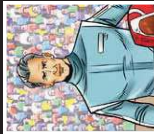
נהג מרוצים רחסי, אלים במיוחד, מתח איום על יוני, פתורתי הגדולה. אלקס