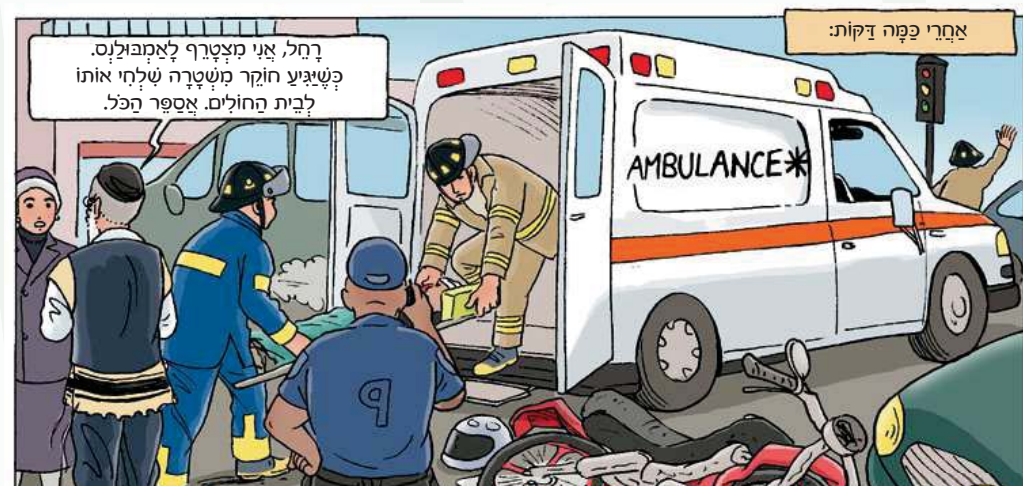
אחרי כפרה דקות:

רחל, אני מצטרף לאמבולנס. פשיגוע חוקר משטרה שליחי אותו לבית החולים. אספר הכל.