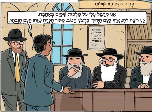
בבית הדין בירושלים

אני מקבל עלי על מלכות שמים באהבה. אני רוצה להצטרף לעם היהודי מראוני הטוב, מתוך הכרה שזהו העם הנבחר.