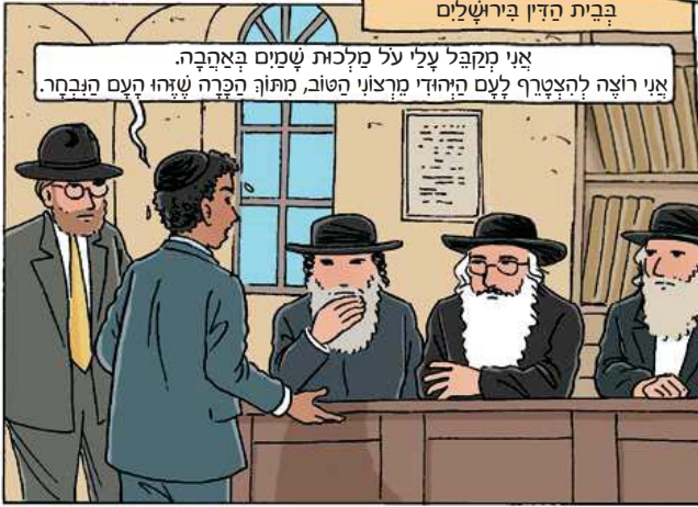
בבית הדין בירושלים

אני מקבל עלי על מלכות שמים באהבה. אני רוצה להצטרף לעם היהודי מראוני הטוב, מתוך הכרה שזהו העם הנבחר.