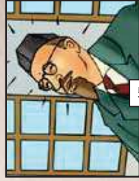
יש לך משה...!