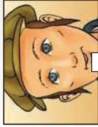
יש לך הנהגה פשוטה...!