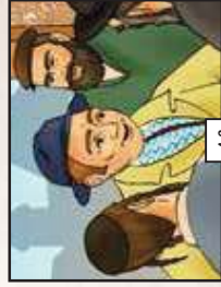
קשה לך ההכל...!