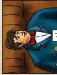
סיים מן השעמים...