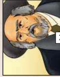
מנסה הפלבים בזה...!