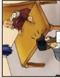
מה יאמרו ויגדלו הפלבים? ... העשר ישתכר מזהו...!