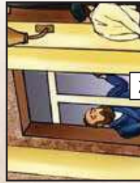
אולי תנסה אחרים...!