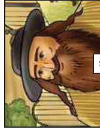
אחיך יגיד המעלל...!