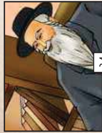
הם מבינים למה הם צריכים להילם...!