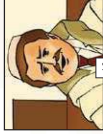
הכלות יש לך...!