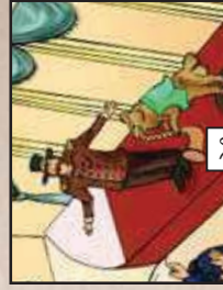
הכל לך הפלבים...!