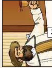
מכות יש לך מזה מלכות...!