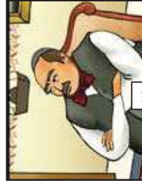
הנה ספחה פשוטה...!