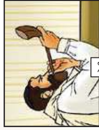
לעצב אותי עם חמא...!