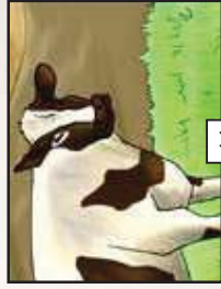
מה האור למה?...