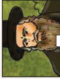
מה יאמרו ויגדלו הפלבים? ...