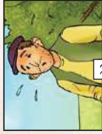
שום קשר יש לך...?